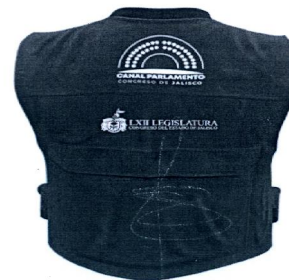
Tipografía | 2.5