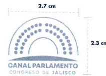
Positivo / Negativo | 2.4