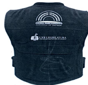
Tipografía | 2.5